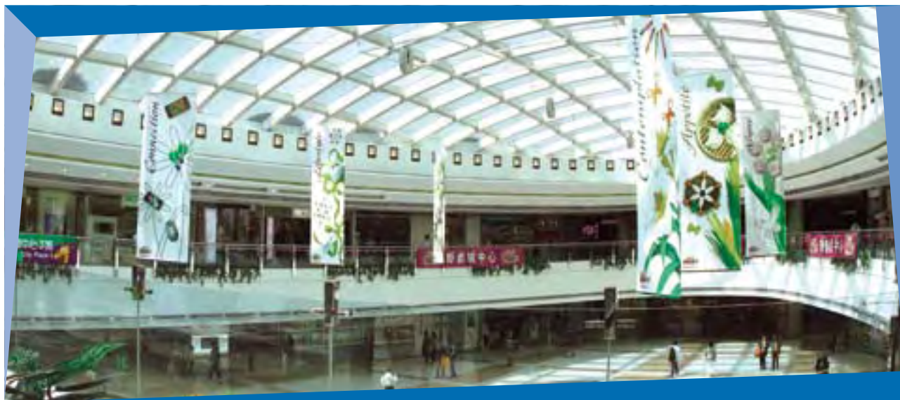
重新間隔後的將軍澳新都城二期商場