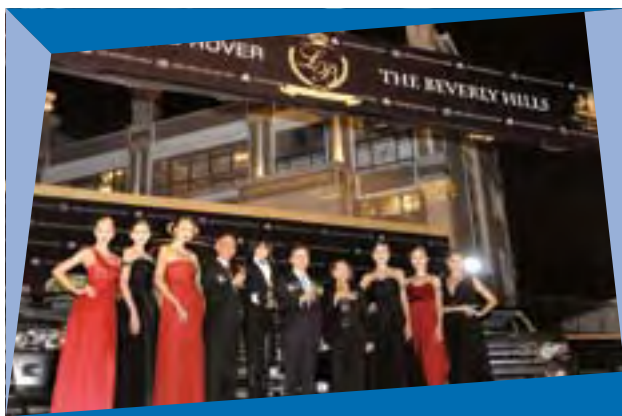
於比華利山別墅舉行之越野路華二零一零年全新車系發佈會

恒基兆業一如往年，舉行一連串推廣活動為比華利山別墅之顯赫豪宅市場定位造勢，讓各參與者親身體驗此罕貴物業得天獨厚的優越環境。其中由英皇鐘錶珠寶主辦之皇室瑰寶展，加上英皇娛樂歌手精彩絕倫之表演，彰顯了比華利山別墅住戶華麗且魅力非凡之生活品位。