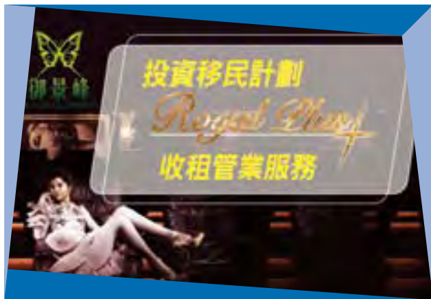
集團為御景峰業主推出「Royal Plus 收租管業服務」

為迎合居於香港境外地區之投資者，特別是內地投資者之需要，御景峰推出名為「Royal Plus 收租管業服務」之完善綜合售後服務，令境外投資者安心投資，無後顧之憂。御景峰整體策略成績斐然，開盤首三天之銷售成績已超過預定目標。