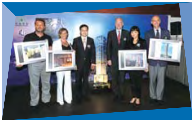
天匯之一眾專業精英團隊

集團旗下物業一向以新穎、創意、令客戶滿意作為賣點，屢備受市場讚譽，而天匯之推出更再次肯定了恒基地產在業內的領導地位。天匯此項嶄新奢華之住宅項目僅提供66所超豪府第，座落於半山干德道尊貴地段，與香港金融中