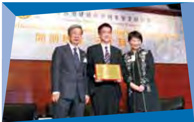
集團獲頒發「積極推動安全獎」

集團除關注其建築項目，對推動業界發展亦不遺餘力。公司建築部總經理現為建造業議會委員，而憑藉其豐富經驗及卓越領導才能，現再被邀請出任為「建造業訓練委員會」及「人力培訓及發展委員會」主席，為本港未來數年因應十大基建及相關工程陸續開展而培訓人才。