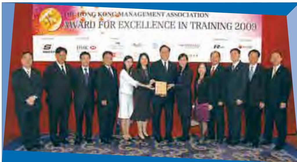
2009年最佳管理培訓獎頒獎典禮

集團旗下之物業管理服務，於內地亦獲得廣泛認同。廣州恒寶華庭為集團管理之住宅社區，繼年前獲頒「廣東省優秀物業管理示範小區獎」及「廣州市優秀示範小區獎」後，於二零零九年又再獲評為「廣東省城市體育先進社區」；至於另一由集團管理之新近建成住宅社區——廣州恒荔灣畔花園，亦獲廣州市物業管理協會頒發「廣州市物業管理示範住宅社區」。「恒益」及「偉邦」日後將繼續開拓內地市場，積極配合集團發展，並為集團廣佈內地之樓盤提供優質之交樓及管理服務。